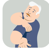
الكتفين أو الظهر