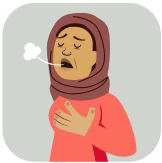
ਸਾਂਹ ਲੈਣ ਚ ਤਕਲੀਫ